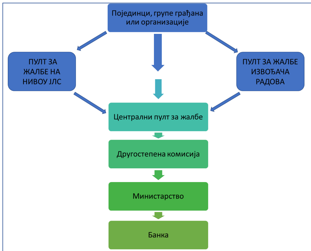
Слика 1. Шема функционисања жалбеног механизма

доноси Другостепена комисија образована решењем министра грађевинарства, саобраћаја и инфраструктуре. Организација ЖМ-а је представљена на слици 1 овог документа.